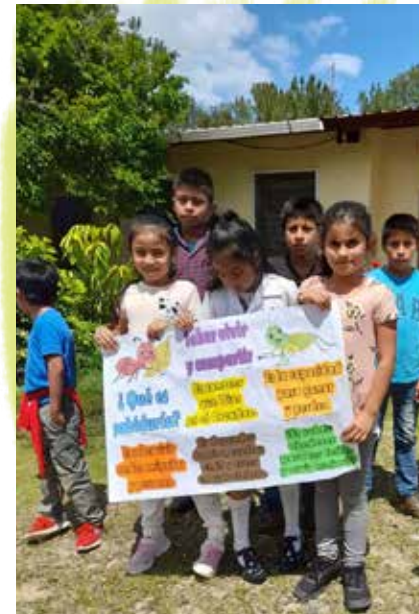
Sharing is caring in Guatemala