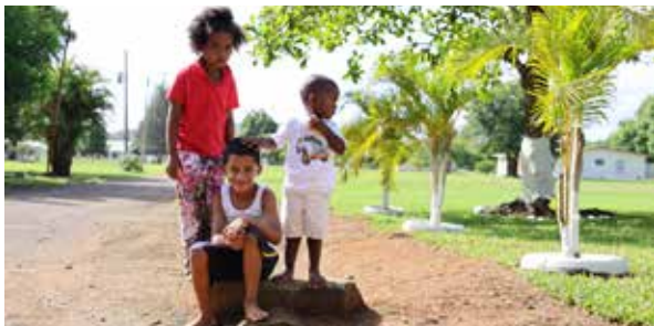
Kinderen in het kinderdorp in de Dominicaanse Republiek