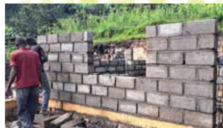
De bouw van de huizen gaat gestaag door

Hoewel we eigenlijk niet genoeg capaciteit hadden om deze kinderen op te vangen, besloten we toch door te zetten. Je laat een kind immers niet alleen achter in de jungle! Inmiddels hebben we twee extra huizen gebouwd en zijn we begonnen aan de bouw van een derde huis. Voor dit huis hebben we echter nog financiële steun nodig. We kunnen dit niet zonder uw steun realiseren. Doneer nu ook via de QR code of doe een donatie via de website of bankoverschrijving o.v.v. Congo14. Bedankt!