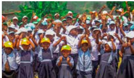
Blijde kinderen in Congo met onze jubileumcaps!