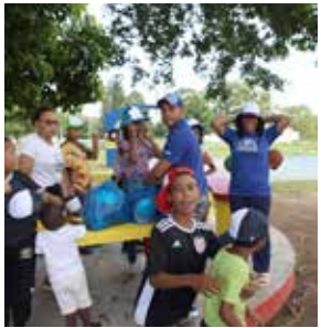
Caps worden uitgedeeld