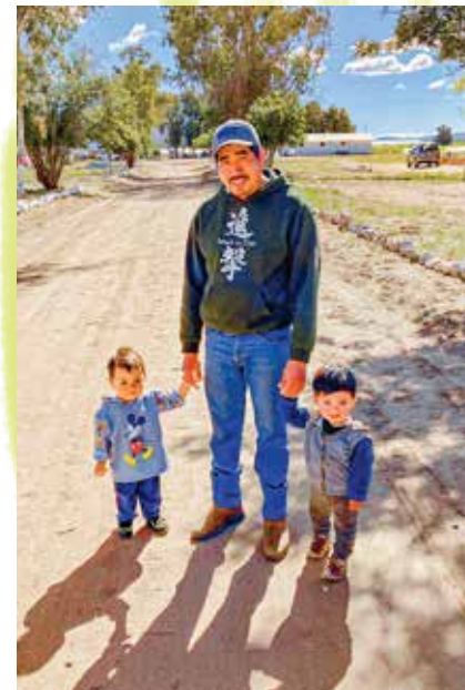
Clemente wandelt een stukje met de kleintjes