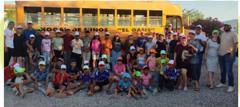
Een gezellige groepsfoto uit El Oasis, Mexico, ook met caps ter gelegenheid van ons 30-jarig bestaan