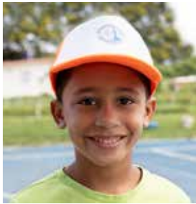
voor iedereen een passende