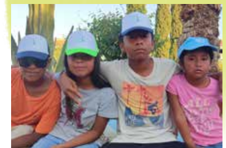
Ook de iets oudere kinderen waarderen de cap