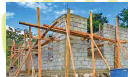
Stevige constructies worden neergezet

Patmos-kinderdorp: help ons ze een toekomst te geven!