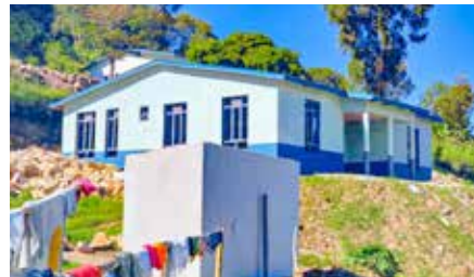
Een van de nieuw gebouwde huizen in Congo