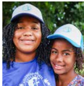
Vriendschap voor het leven