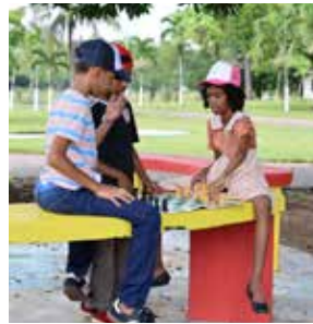
en schaken gaat beter met cap