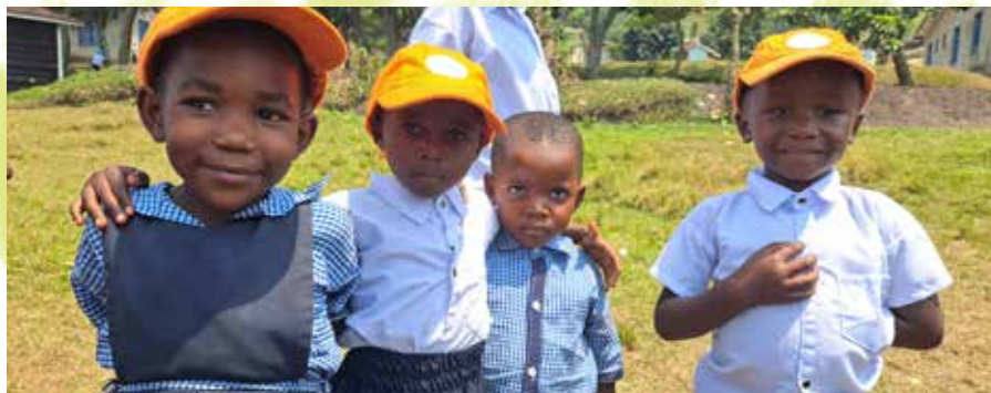
De geredde kinderen uit de jungle in Congo bloeien op en maken het goed!