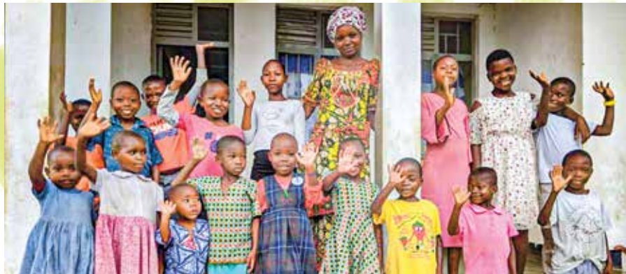
Een liefdevolle huismoeder biedt deze kinderen een warm thuis in één van onze huizen in Congo