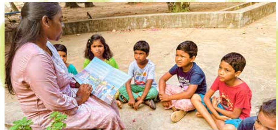
Eén van de huismoeders in India leest de kinderen voor