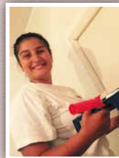
Helpen is altijd leuk!