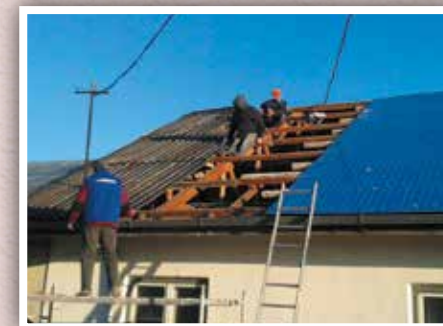
We gingen meteen aan de slag.

De donateur bood spontaan aan om deze kosten op zich te nemen. Geweldig! Daardoor kwam dit project ineens