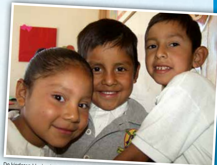
De kinderen bloeien helemaal op door de goede zorg.