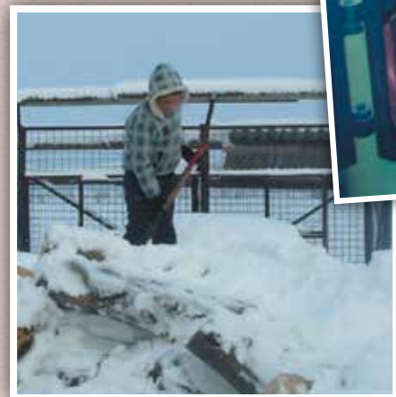
Dankzij u hoeft er minder hout gehakt te worden!

Dank u dat u de kinderen niet in de kou heeft laten staan!