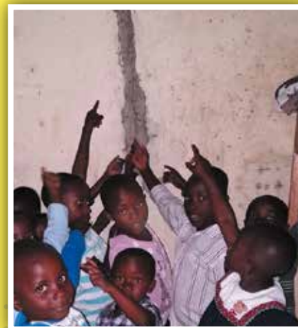
De kinderen zijn erg bezorgd.

De volgende dag zagen we de schade pas goed: de gevolgen van de aardbeving waren groot. De school was erg beschadigd, slechts 2 lokalen kunnen we nu nog gebruiken als noodlokaal.