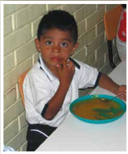
Het water wordt ook gebruikt om het eten te bereiden.

Het gaat goed met ons kinderdorp in El Salvador. Sinds de oprichting in 1995 is er dankzij de hulp van mensen zoals u al veel bereikt. Het kinderdorp heeft al veel kinderen een thuis mogen bieden. Op dit moment wonen er 46 kinderen, die eten, drinken, kleding, scholing en medische zorg nodig hebben. Hoe zelfstandiger het kinderdorp is, hoe meer kosten we kunnen besparen en hoe meer steun we de kinderen kunnen geven. Daarom richten we ons op projecten die daarbij helpen.