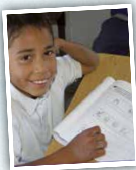
Met goede verlichting kunnen de kinderen ook 's avonds hun huiswerk maken.

Uw ondersteuning is daarbij ontzettend belangrijk!