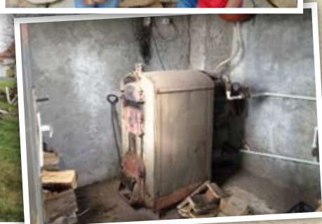
Met de gekloofde houtblokken wordt deze ouderwetse houtkachel gestookt zodat de kinderen geen kou hoeven te lijden in de winter.

lootjes te koop, waar leuke prijzen mee te winnen waren. Deze prijzen werden beschikbaar gesteld door de winkeliers. De opbrengst van de lootjesverkoop was bestemd voor de stookhoutactie. Wanneer zij meer dan € 1000,- zouden ophalen, wilden een aantal winkeliers op oudjaarsdag de kou trotseren door een duik te nemen in een zwembad op het winkelplein. Met een extra bijdrage van Sipke Meijer van dierenpeciaalzaak 'De Leeuwerik' én de toezegging dat Richard v.d. P. ook een