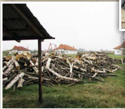
Het stookhout voor het Roemeense kinderdorp is geleverd. Nu moet het nog gezaagd en gekloofd worden!