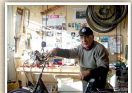
In het miniwinkeltje in Zwijndrecht fietsen repareren.