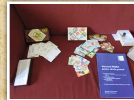
Het lesmateriaal waarmee gewerkt wordt